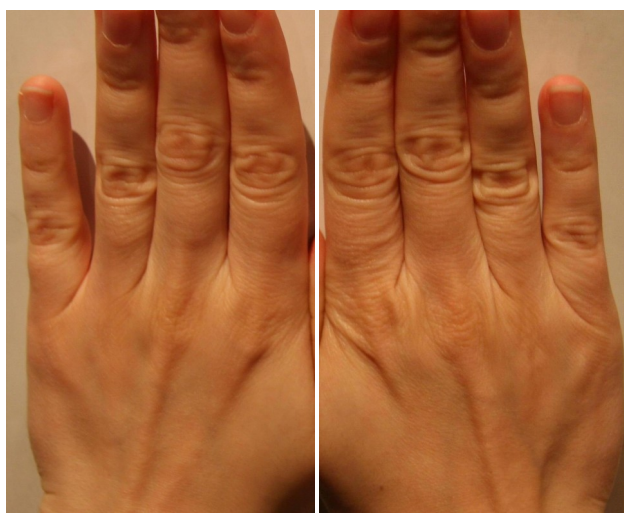
Pēc 5 minūtēm

Pasteidzies, jo komplektu skaits ir ierobežots!