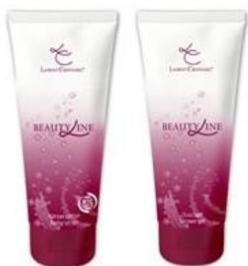
Roku kreams 75ml Ķermeņa kreams 200ml Dušas želeja 200ml

Anti Aging ķermeņa kopšanas komplekts ar roku kreamu, ķermeņa kreamu un dušas želeju! Īpašs Ziemsvētku Dāvanu Komplekts €60.00