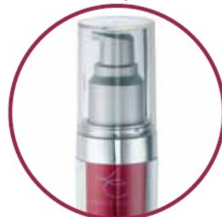
Anti-Aging System 12h-Active-Serum The 12h long term care effect

Apmeklē "Sarah's Beauty" salonu savas dāvanas iegādei 2 Talbot Place, Dublin 1 vai zvani Baibai uz 086 0778940 & nodrošini savu komplektu!